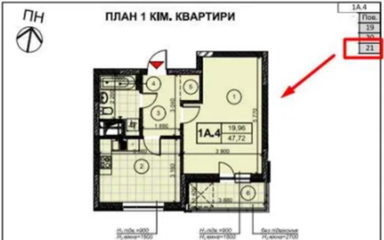
Схема розташування квартири на поверсі