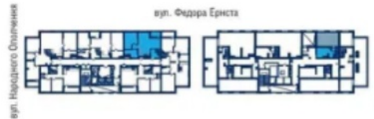
Схема розташування приміщень на поверсі